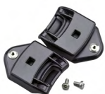
WAC00003 BAJONETVERSCHLUSS FUER GEOHRSCHUTZMUSCHELN