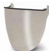
WV100003 VISOR FULL FACE